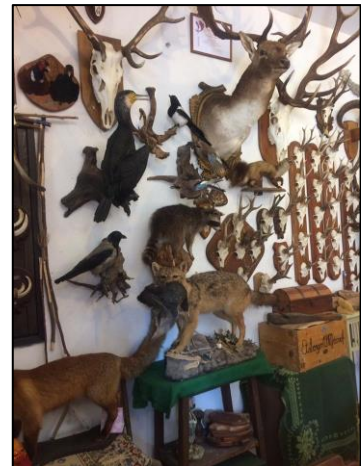
EZ JÓ MULATSÁG VOLT!